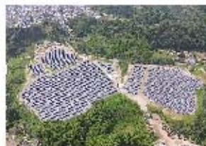
環境エネルギー事業 (メガソーラー・産業用太陽光発電所の分譲販売)