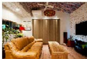
住宅・店舗 リフォーム事業