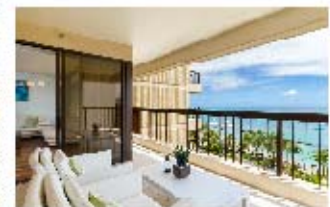
ハワイでの建築・リフォーム事業