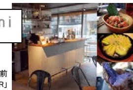
渋谷区神宮前 「KAKA'AKO DINING&BAR」