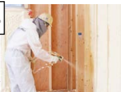
ウレタン吹付の様子