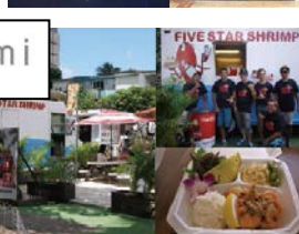
ハワイ・オアフ島 「FIVE STAR SHRIMP」