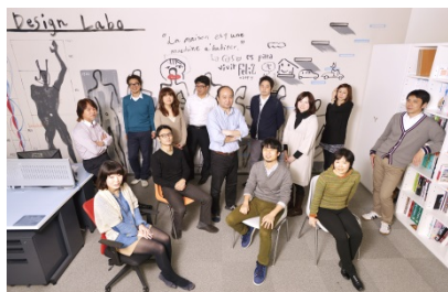
デザインラボ メンバー

タツミプランニングの注文住宅は、一般的な注文住宅よりもデザイン性・機能性に優れ、かつリーズナブルであることから高い評価を得ています。アーキストハウスプロジェクトでは、注文住宅の概念を越え、施主のライフスタイルまでデザインし、人生を家で表現する本プロジェクトの核をデザインラボが担い、今までにない家づくりに向けて挑戦してまいります。