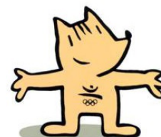
バルセロナ・オリンピック マスコット「コピー」

「日本は海に囲まれた大地のひとかけら。 地中海は大地に囲まれた海のひとすくい。 マリスカル・ハウスは地中海と日本とをフュージョンしたものです。 パティオは家のハートで出会いの場。光、ガーデン、オープンエアー… 日本サイズの空間に地中海の魅力を！」