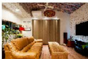
住宅・店舗 リフォーム事業