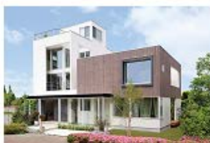
新築住宅の建築事業