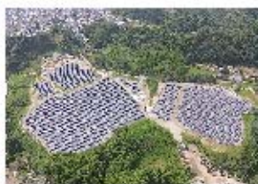
環境エネルギー事業 (メガソーラー・産業用太陽光発電所の分譲販売)