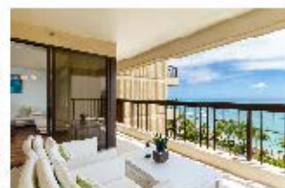
ハワイでの建築・リフォーム事業