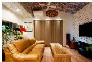
住宅・店舗 リフォーム事業