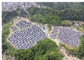
環境エネルギー事業 (メガソーラー・産業用太陽光発電所の分譲販売)